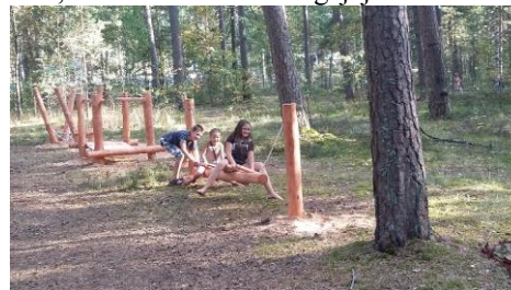
1.,2. att. Uzstādīšanas darbi Ūdensrožu parka takā.

Šie ir pirmie soļi Ūdensrožu parka izveidei un attīstībai, lai iegūtu sakoptu un atpūtai piemērotu vietu Kadagas ciemā. Tā kā meža teritorija ir vairāk kā 21 ha liela, ir vēl daudz vietas dažādu aktivitāšu zonām klusā priežu mežā.