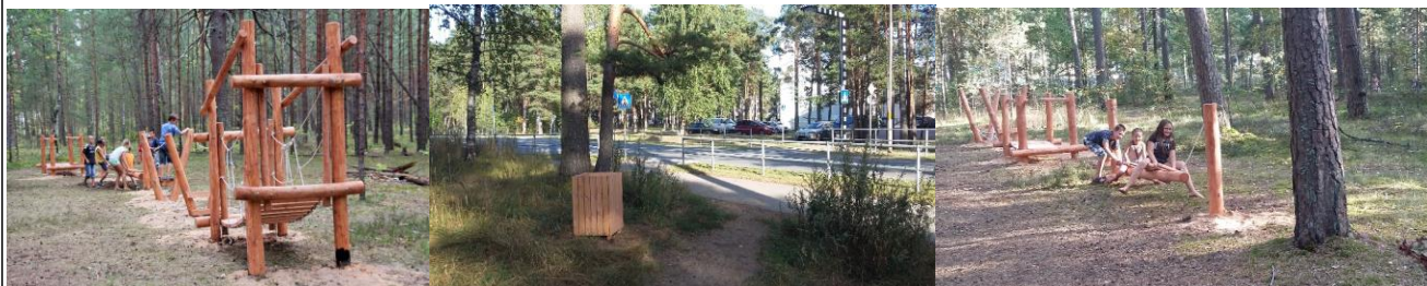
3.att uzstādītās iekārtas šķēršļu takā un atkritumu urnas.