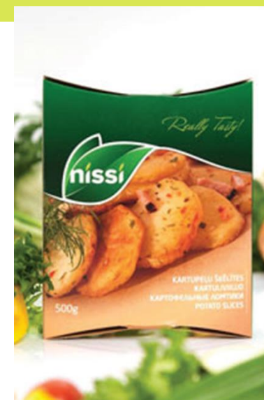
Kartupeļu pārstrādes produkti, SIA "Paplāte Nr.1", SIA "Nissi"