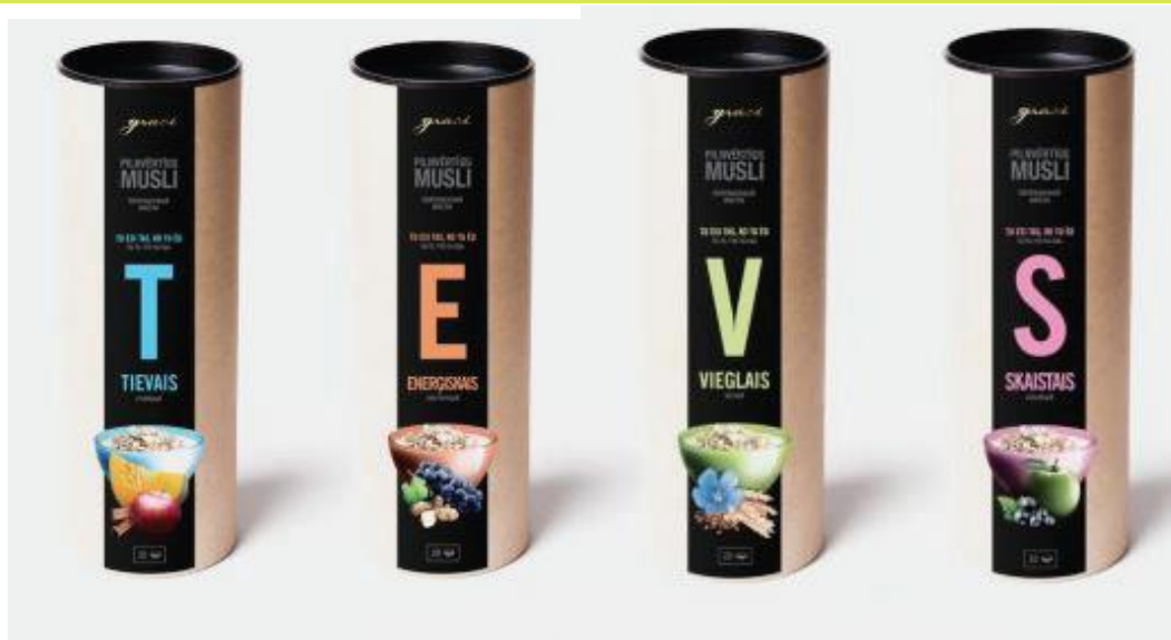
Graudaugu pārslu maisījumi "Musli" SIA "Felici"