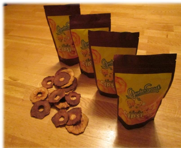
Ābolu un bumbieru čipsi SIA "Garden Snacks"