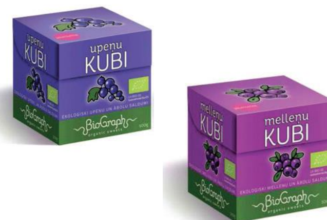
Augļu kubi SIA "Biograph organic sweets"