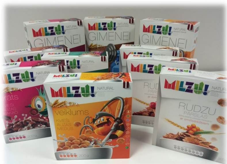
Graudaugu pārslas "MILZU!" SIA "MILZU!"