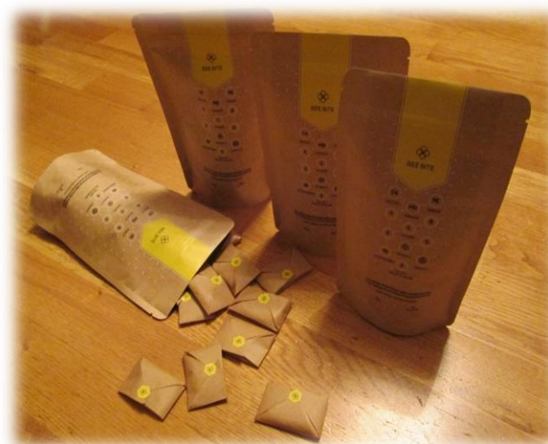
Bišu maizes pastilas SIA "Bee Bite"