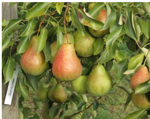
2. att. Šķirnes 'Tavričeskaja' uz BA – 29 augļi.