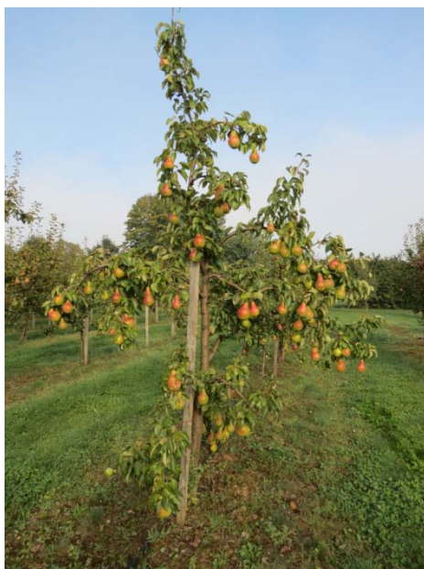
1. att. Hibrīds BP – 8965 uz BA 29.

Šķirnes 'Mramornaja' koki uzrādīja būtiski mazāku ražošanas efektivitāti – tikai 0.13 kg cm -2 jeb vidēji 3 kg no koka. Šai šķirnei konstatēti daudz bojāto augļu – vidēji 2 kg no koka. Galvenokārt konstatēti putnu bojājumi, bet daudz bija arī puves bojāti augļi. Uz cidonijas potcelma augstu ražību uzrādīja šķirne 'Tavričeskaja' un hibrīds BP – 8965.