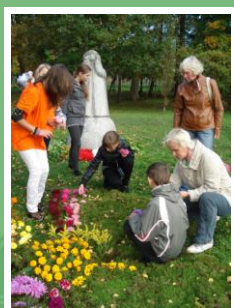
Veidojam rudens ziedu paklāju