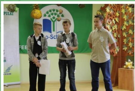
Jaunpiebalgas mazpulcēni šogad pētījuši mežu, aizsargājuši un novērojuši ērgļa ligzdas vietas, iepazīnuši kokapstrādes biznesu