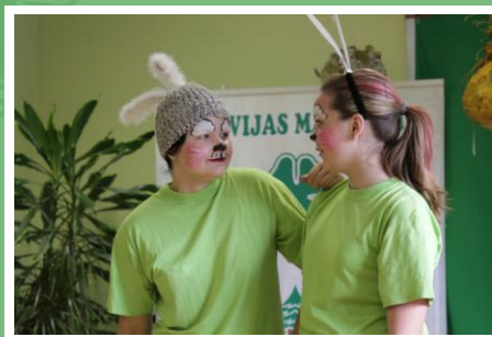
Valkas foruma dalībniekus sagaidīja un uzmundrināja Pauks un Šmauks