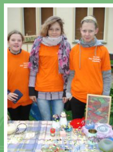
Neretas mazpulkā čaklas rokdarbnieces