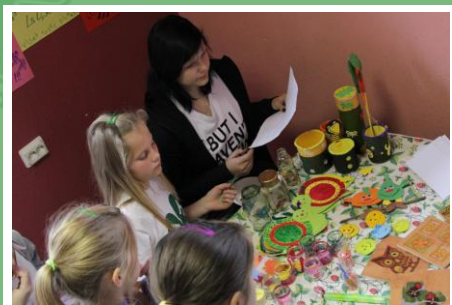
Varam pelnīt ne tikai tirgojoties, bet arī organizējot loteriju, izsoli vai konkursu ar balvām