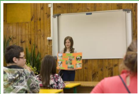
Čaklam un mērķtiecīgam darbam ir rezultāti, tie jāprot arī pārlicināši prezentēt