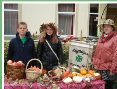
Dignājas mazpulks saposies "Mazpulcēnu tirdziņam"