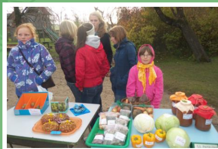
Apgūstam tirgotāja pieredzi