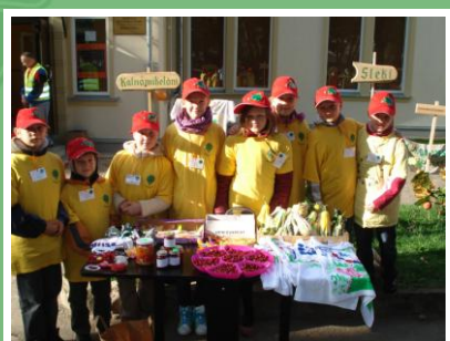
Jēkabpils mazpulcēni čakli gatavojušies forumam