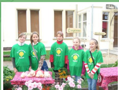
Sunākstes mazpulka dalībnieces