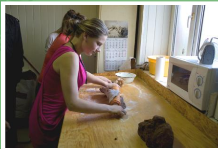
Apgūstot praktiskā darba prasmes varam pārlicināties, kādu nākotnes izglītību un profesiju izvēlēties