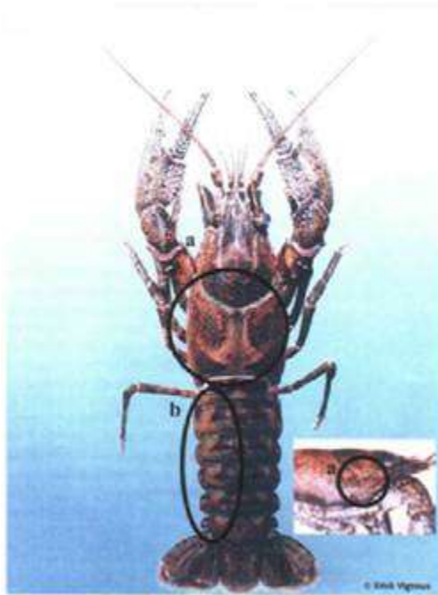
4.attēls. Dzelonvaigu vēzis

4.2. sarkanbrūni svītrveida plankumi uz vēdera daļas segmentu virspuses (atšķirība no šaurspīļu vēža).