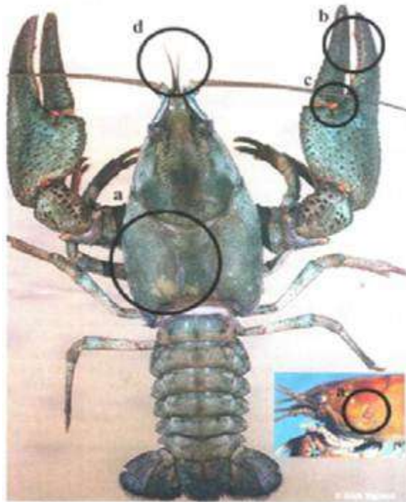
1.att. Platspīļu vēzis